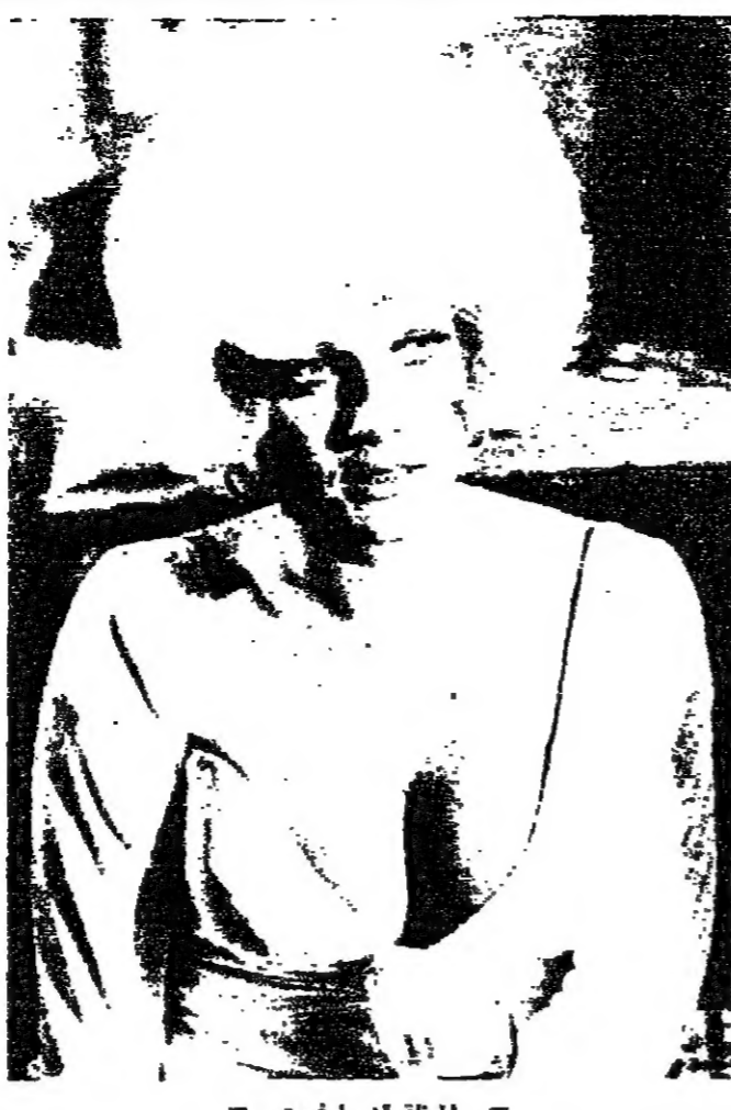
المطلة ان مارغريت

يقدم رجال الاطفاء في لبنان فرنسيسكو الى رجال بروليس الهبطية الصربين ، اعترضوا الاعراب عن العمل تقصير تلك اعمام من وكسب القليلة بينهم عوامل من الكسب .